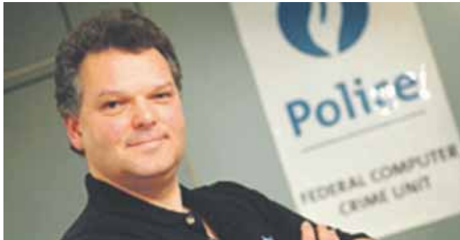
ECOPS. «Notre but est de permettre aux internautes de nous donner une information de départ tangible afin que nous puissions enquêter à ce sujet.»

Réponse: En tant que citoyen responsable, vous devez en parler à la police mais pour cela, il n'est pas nécessaire de vous déplacer. Rendez-vous sur le site www.ecops.be .