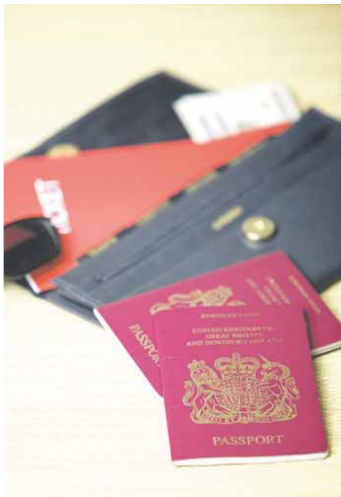
PERDU? Si votre document d'identité est perdu, appelez Doc Stop. Comme ça vous éviterez l'usage frauduleux.

Par la suite, Doc Stop vous enverra un courrier vous confirmant votre signalement de perte ou de vol. Si vous retrouvez vos papiers, vous disposerez à partir de votre appel, de 7 jours pour annuler votre déclaration. Dans le cas contraire, le document d'identité sera ratifié et