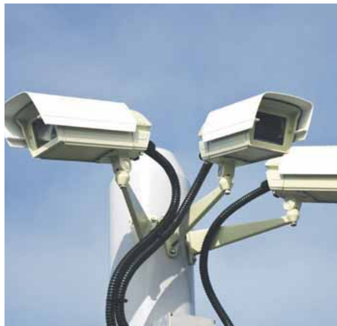
CAMÉRAS. Depuis 2007 l'installation et l'utilisation des caméras de surveillance sont réglementées.

Dans les aéroports, nous sommes sans cesse surveillés, vu les tentatives d'attentats terroristes qui marquent malheureusement notre actualité. Des scanners de sécurité sont progressivement déployés dans les aéroports de nombreux pays, principalement aux Etats-Unis et au Canada. Au niveau européen, ces appareils sont encore au stade du test. En fait, ces scanners sont capables de dé-