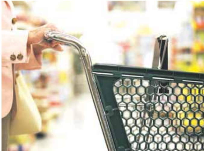
TEMPÉRATURE. Quand vous faites vos courses, faites attention aux températures!