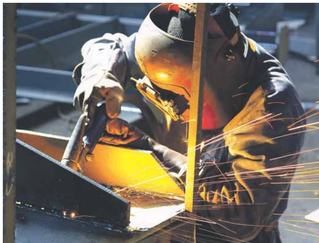
PROTECTION. La protection et la prévention sur le lieu de travail concerne aussi les moyens de protection individuels.