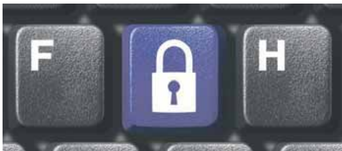
EN LIGNE. Sur des sites dits de réseaux sociaux comme Facebook ou Twitter, la marge réussite de tels criminels est large.

Sur des sites dits de réseaux sociaux comme Facebook ou Twitter, la marge de réussite de tels criminels est large. En effet, qui se méfie de quelqu'un qui veut devenir votre ami et qui semble sympathique et pourquoi pas, intéressant socialement? Pourquoi ne pas ouvrir les portes de votre maison aux personnes de votre entourage et permettre à ceux que vous ne connaissez pas, de vous approcher?